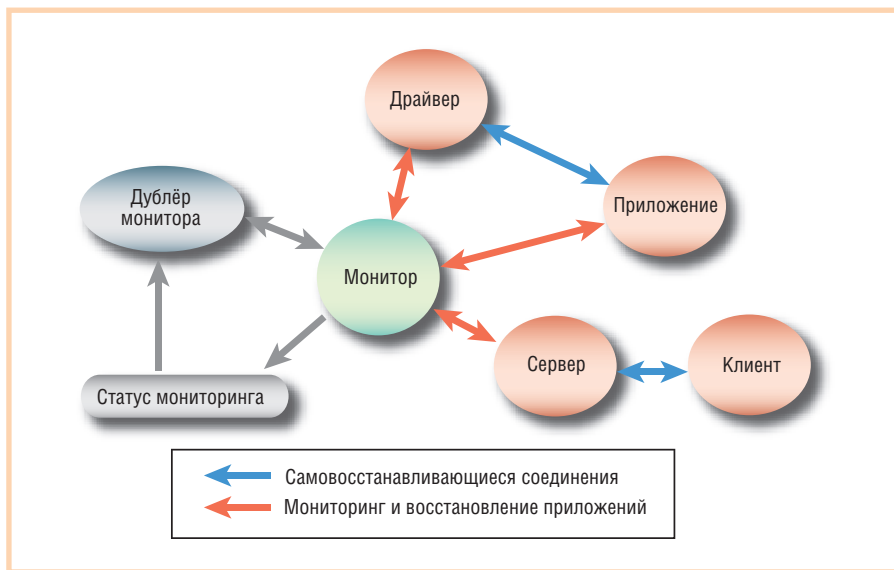
Рис. 3. Схема использования технологии автоматического восстановления процессов и соединений

Чтобы выполнять свои задачи монитор для начала «клонировает» самого себя, то есть порождает дублирующий процесс, которому, используя механизм разделяемой памяти, предоставляет полную информацию о мониторинге АС [2]. Монитор и его дублёр строго следят друг за другом, и при сбое одного из них второй процесс немедленно порождает новый процесс-дублёр. В качестве объекта мониторинга могут быть заданы любые (серверные или клиентские) процессы, выполняющиеся как на той же ЭВМ, что и монитор, так и на других узлах Qnet. Для каждого из объектов мониторинга указывается перечень событий, на которые следует реагировать монитору. Например, событиями являются завершение процесса-объекта или его перезапуск. И, наконец, для каждого из событий определяется реакция – действие или перечень действий.